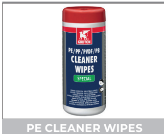
PE CLEANER WIPES

PE, PP, PVDF, PB REINIGER + ONTVETTER DECAPANT ET DEGRAISSEUR POUR PE, PP, PVDF, PB PRIMER AND CLEANER FOR PE, PP, PVDF, PB